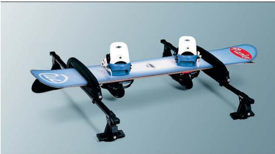
MZ311974 Крепление для 4-х пар лыж или 2-х сноубордов MZ313062 Адаптер для установки крепления на дуги багажника