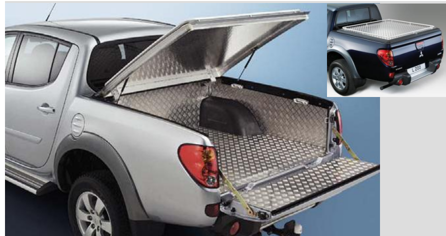
MZ313663L Грузовой поддон низкий (под борт) Устанавливается только с крышкой кузова MZ313650. MZ313650 Крышка кузова алюминиевая с газовыми амортизаторами