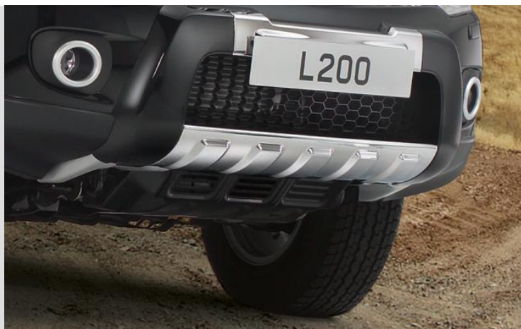
MZ314348 Фары противотуманные (для а/м без расширителей колесных арок!!!)