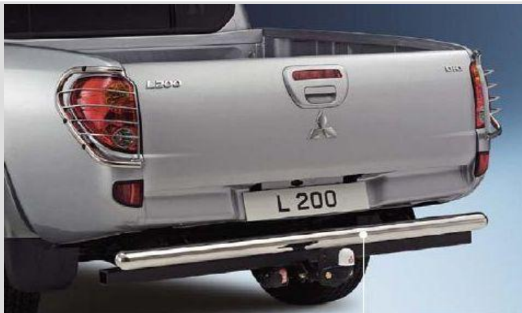
MZ313628 Защита заднего бампера 76 мм Полированная нержавеющая сталь только для комплектаций DC Invite и DC Invite +