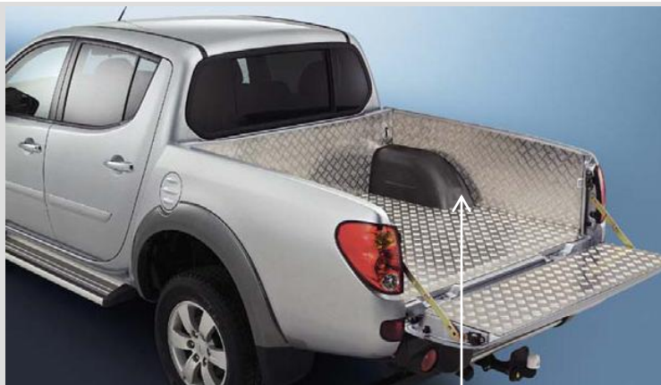
MZ313663 Грузовой поддон (над бортом) Не устанавливается с MZ313650 !!!