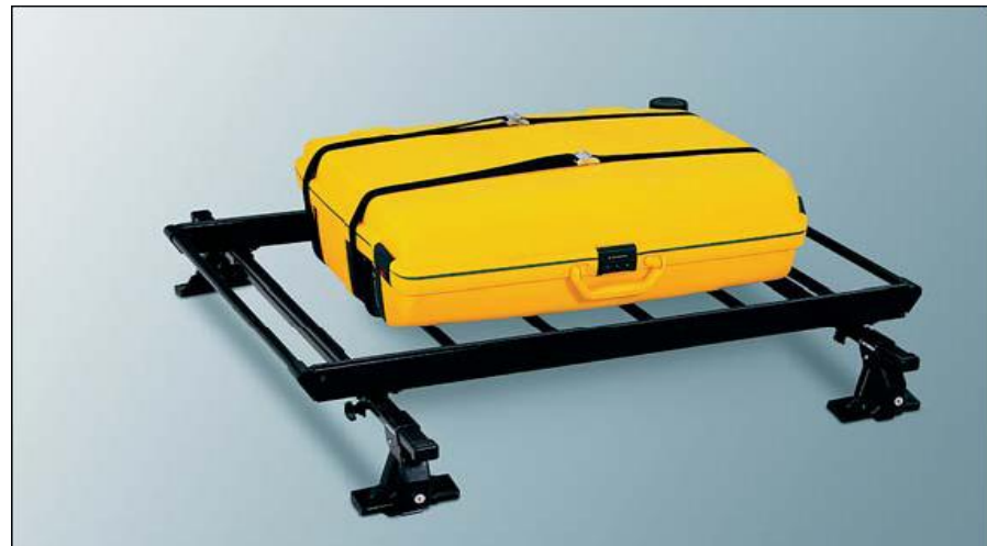
MZ535826 - Платформа для багажа (черная сталь, 75x100 см)