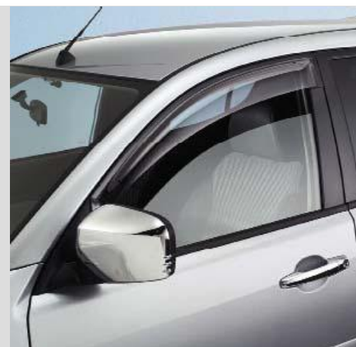
MZ313754 Накладки на зеркала заднего вида, хром. В к-те 2 шт.