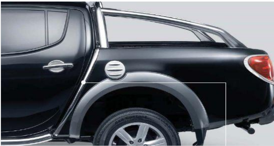
ММЕ31609 Накладки на передн углы кузова. К-т. Полированная нерж. сталь