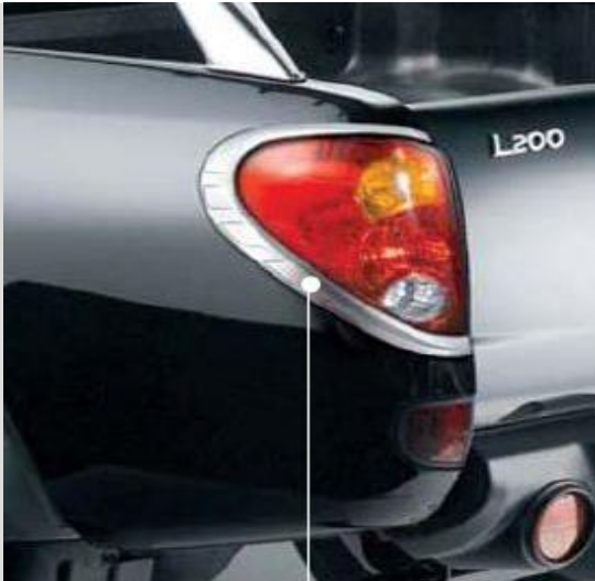
ММЕ31662 Окантовка задних фонарей хром