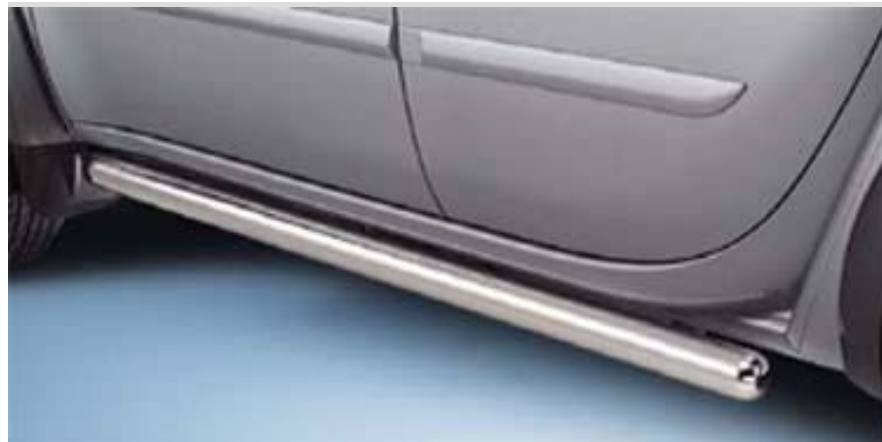
MZ313621 Защита порогов, труба 76мм Полированная нержавеющая сталь