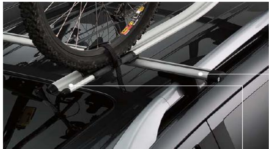
MZ313538 Крепление для велосипеда (алюминий)