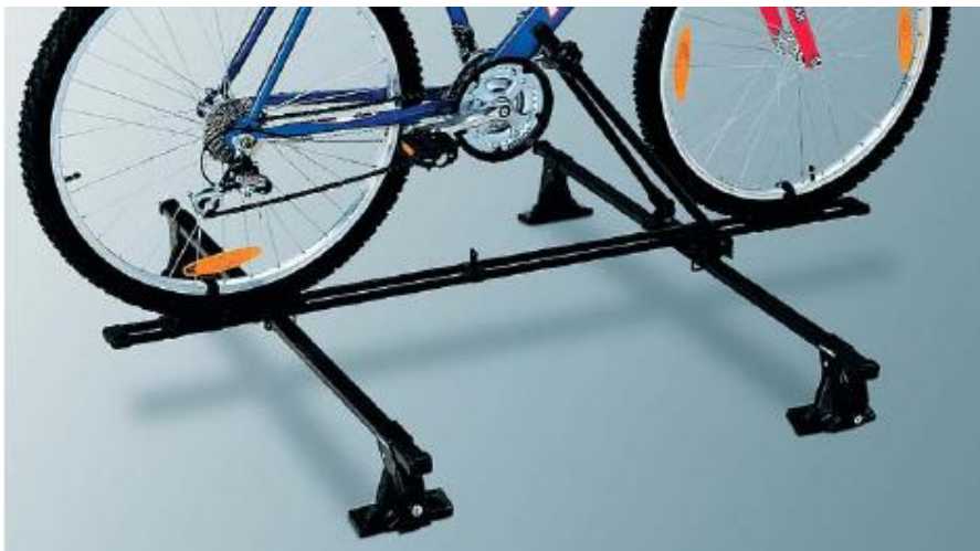
MZ314156 Крепление для велосипеда (черная сталь)