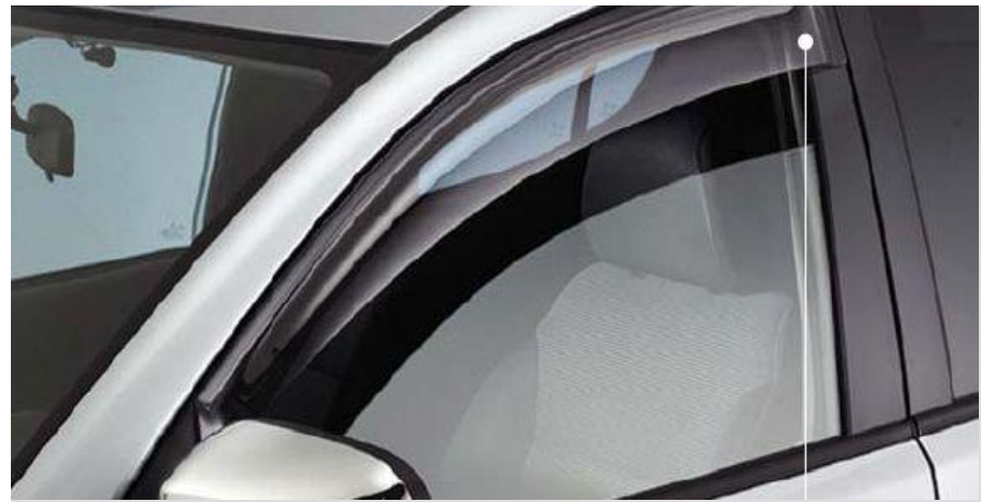
MZ313721 Дефлекторы передних окон 2 шт.