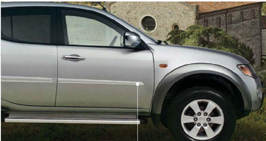
MZ313632 Молдинг боковой, цвет серебристый Может быть покрашен в цвет кузова