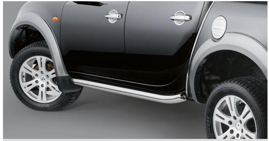
ММЕ31598 Накладка крышки лючка бензобака. Полированная нерж. сталь