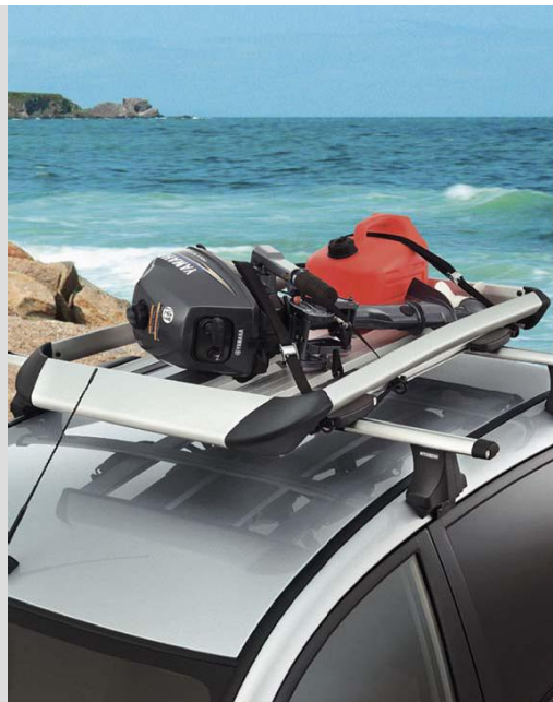
MZ313529 – платформа для багажа алюминиевая, 128x79см аэродинамический дизайн