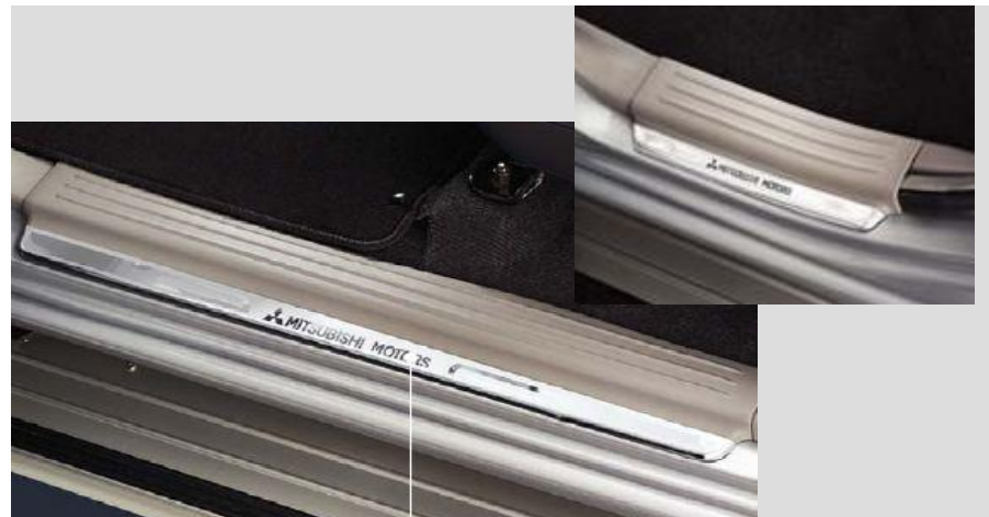
MZ330117 Накладки порогов, 4 дв. Нержавеющая сталь